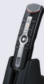
La station d'accueil avec détection de position automatique permet d'effectuer une dictée en mains libres