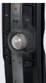
Bille de commande avec capteur de vitesse