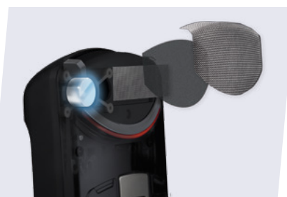
Filtre Pop, triple couche pour de meilleurs résultats en reconnaissance vocale