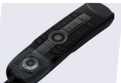
L'emplacement du haut-parleur fermé permet une bonne qualité de son